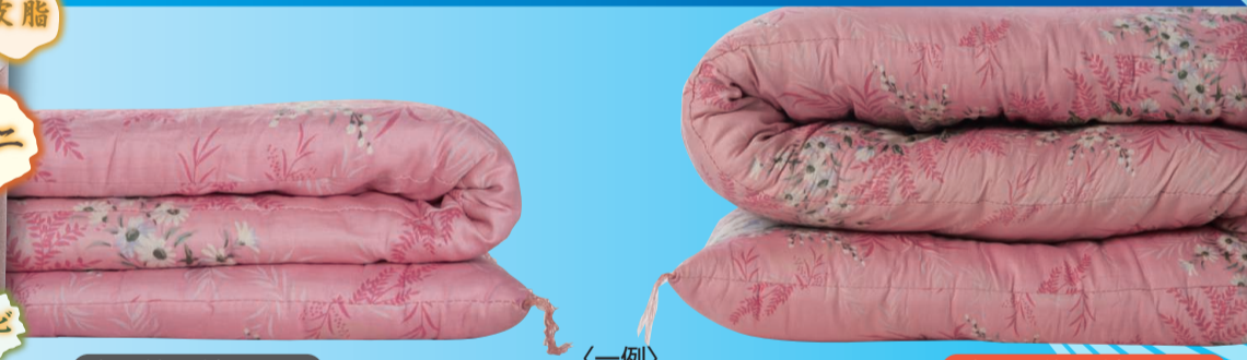
洗う前の綿ふとん