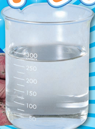
洗い終りの洗浄排水