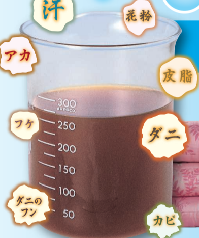
洗い始めの洗浄排水

※繊維上の特定ウイルス数を減少させる加工です。病気の治療や予防を目的とする ものではありません。全ての菌やウイルスに対しての効果を保証するものではありません