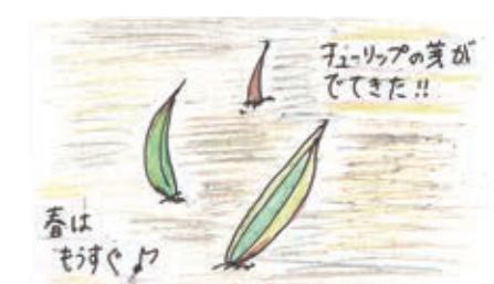
かほく市 まーさん