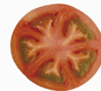
日頃食べている生食のトマト