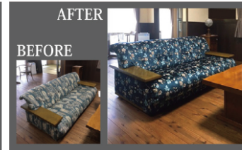
例:ソファの張り替え

メーカー・販売店がわからない場合もお気軽にご相談ください。 ↑クリア家具合同会社公式ブログ