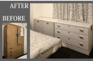
例:タンスのリメイク

修理内容(一例) ◆イス修理(張替え、ぐらつき/ハズレ再接着、木部再塗装) ◆藤張替え ◆ソファ張替え、買い替え相談 ◆天板塗装修理(再塗装) ◆婚礼タンスリメイク