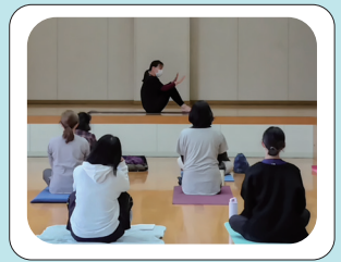
ピラティス教えてもらったよ〜