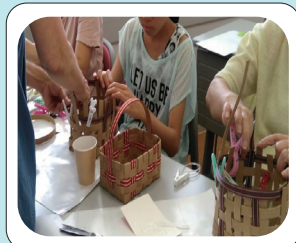
やってみたかったワークショップ