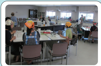
お料理教室もしたいな〜