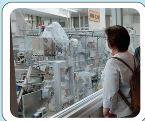
バスに乗って工場見学！