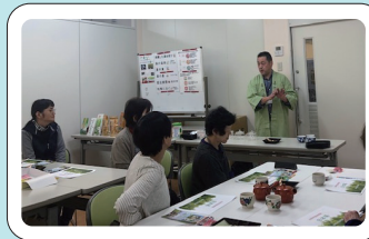
メーカーさん呼びびして学習会

お問合せ・資料請求 まってるね！ お申込みは右上の イベントの申込みフォーム またはコールセンターへ