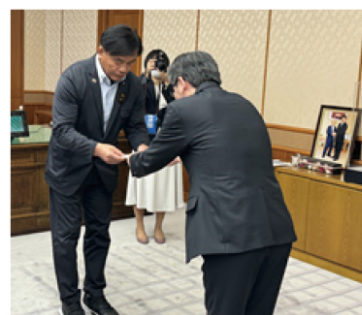
11月20日(月) 県庁にて行われた義援金 目録贈呈式の様子

約7,000人から義援金をお寄せいただきました。 ご協力くださりありがとうございました。