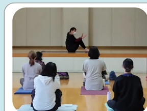
ピラティス教えてもらったよ～