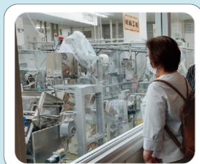
バスに乗って工場見学！

はじめてでも安心！ やりたいこと！興味のあること！コープ商品のこと！ 見学してみたい！など、あなたのやってみたいこと をかなえて、コープをたのしみましょう♪