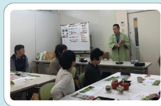
メーカーさん呼びひて学習会

コープくらぶは組合員 3名以上で結成してくだ さい。活動するにあたり 補助があります。お気軽 にお問合わせくださいね。