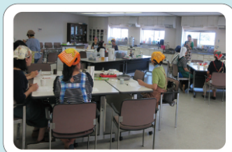
お料理教室もしたいな～