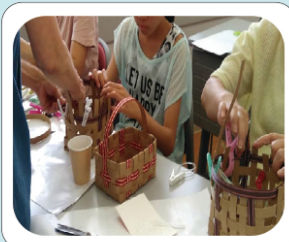
やってみたかったワークショップ