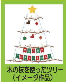
木の枝を使ったツリー (イメージ作品)

講師：かが森林組合 職員の方 定員：20名(応募者多数の場合は抽選) 参加費：500円(材料代) / 駐車場：あり(無料) 保育：なし(お子さま連れでの参加はご遠慮ください) 準備：あればクリスマスの装飾品やビーズなど。 申込方法：右上の イベントの申込みフォーム またはコールセンターから。