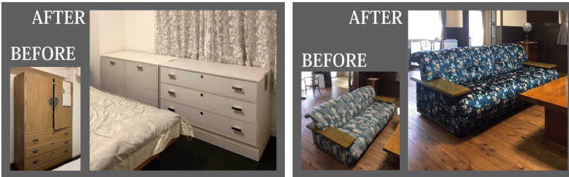
例:タンスのリメイク

修理内容(一例) ◆イス修理(張替え、ぐらつき/ハズレ再接着、木部再塗装) ◆簾張替え ◆ソファ張替え、買い替え相談 ◆天板塗装修理(再塗装) ◆婚礼タンスリメイク