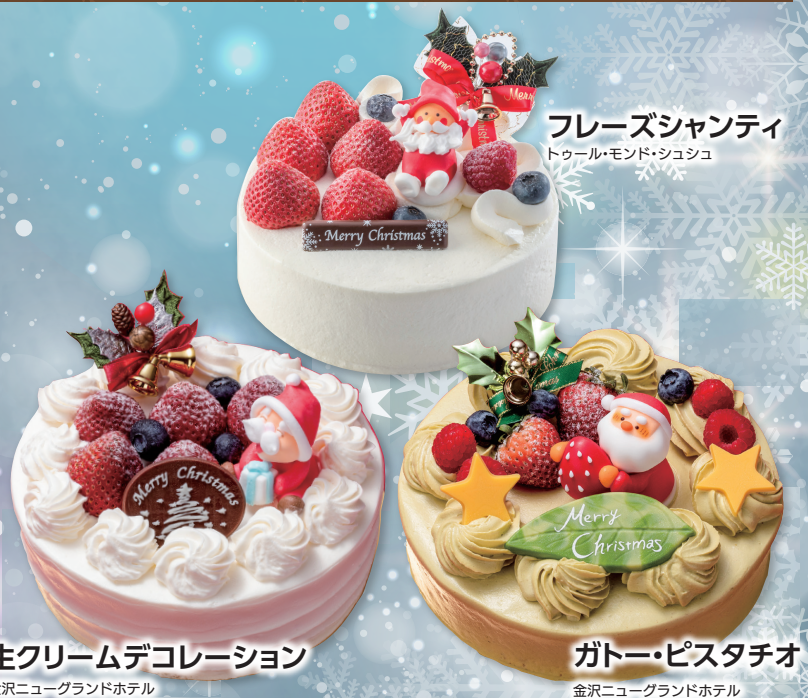
フレーズシャンティ トゥール・モンド・シュシュ

この他にも、下記のクリスマスケーキを掲載しています。 詳しくは「じわもーる」をご確認ください!