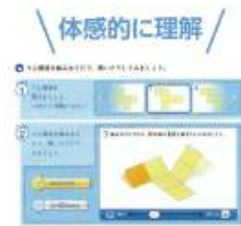
実際にアニメーションを指で触れて体感することで、学びの理解度が高まります。