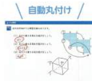
問題を解くと自動的に丸付け。お子さまの学習ペースに合わせてテンポ良く学べます。