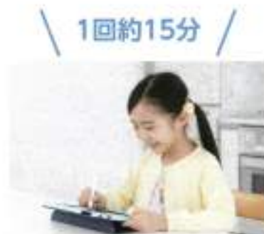
講座は1回15分ほど。毎日少しずつでも取り組めるのが、学習習慣の定着につながります。