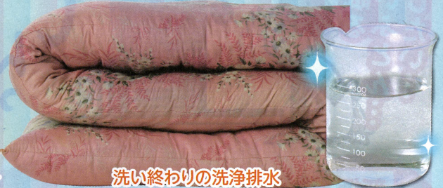
洗い終わりの洗浄排水