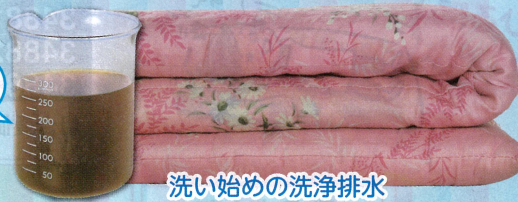
洗い始めの洗浄排水