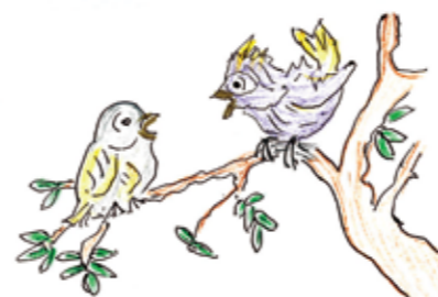
金沢市 シーちゃん