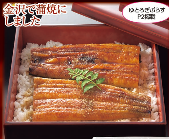
金沢で蒲焼にしました

019 3袋 1,400円 (税込1,512円) 1袋 税込504円 020 4袋 1,850円 (税込1,998円) 1袋 税込500円