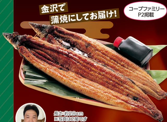
金沢で蒲焼にしてお届け!