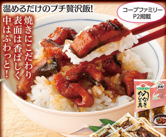
温めるだけのプチ贅沢飯!

016 1尾 2,980円 (税込3,218円) 170g(1尾) 本 300g(2尾) 本 2,980円 (税込3,218円) 017 2尾 5,180円 (税込5,594円) 1尾 税込2,797円 2尾 5,180円 (税込5,594円)