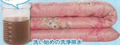
洗い始めの洗浄排水