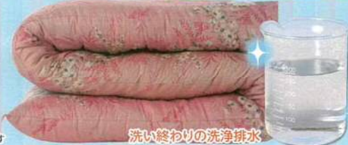
洗い終わりの洗浄排水

「うちのふとんは、 せんたくきがなにかしらと ママはいいました。 「コープのふとん丸洗い すればきれいになりますよ」 と、おまかせしました。 おもいました。」