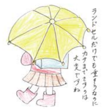
七尾市 びっぴ(6歳)とママ