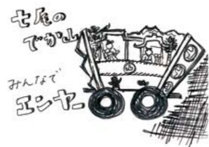
七尾市 ユカタンタン