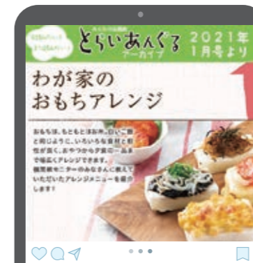
#とらいあんぐるのアーカイブ