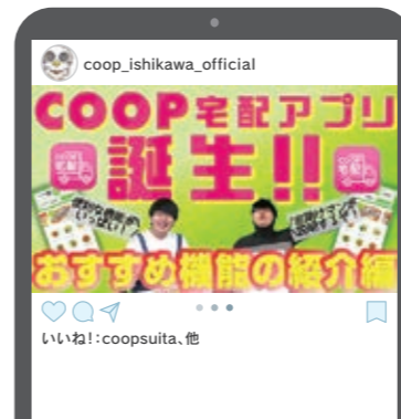
#コープいしかわ宅配情報