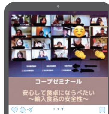
#コープいしかわ組合員活動