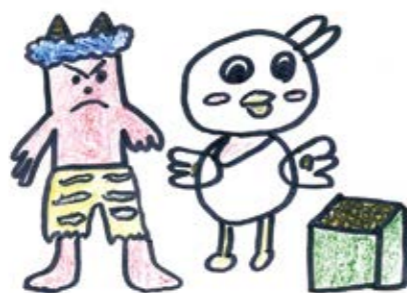
七尾市 ミルクキャラメル(9歳)