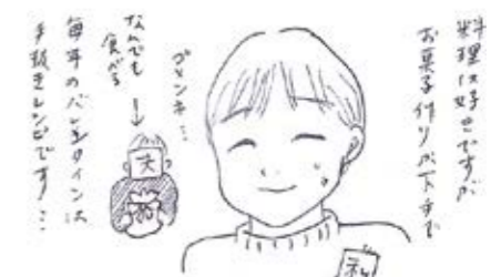
金沢市 ゆっきーな