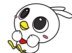
加賀市 わらびもち