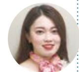
田邊さん ※角質層まで

乾燥する季節はしっかり保湿することももちろん大事ですが、ただ保湿しても肌に浸透*しません。古い角質を取り除いてから必要なものを与えるのが正しいスキンケアです。