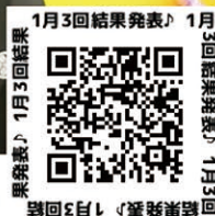
1月3回結果発表! 1月3回結果発表! 1月3回結果発表!