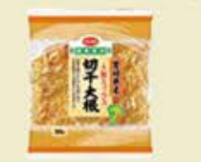
宮崎県産 切干大根人参ミックス (30g)×2袋 (次回1月3回)257円(税込)

【材料(4人分)】 宮崎県産切干大根人参ミックス…30g きゅうり……………1本 ハム……………4枚 ごま油……………大さじ1 酢……………大さじ1 しょうゆ……………大さじ1 砂糖……………小さじ1 塩……………少々 煎りごま……………適量