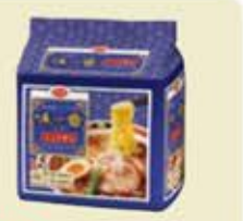
味一番拉麺しょうゆ味 100g(めん77g)×5食 (次回1月4回)397円(税込)

【材料(1人分)】 味一番拉麺しょうゆ味……………1袋 もやし……………30g にんじん……………10g ねぎ(小口切り)……………適量 酢(あれば黒酢)……………大さじ1 水溶き片栗粉(片栗粉小さじ1、水小さじ2)…大さじ1 たまごスープ……………1袋