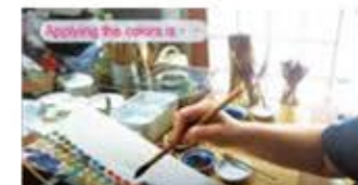
▲制作した動画をYouTubeで発信しています