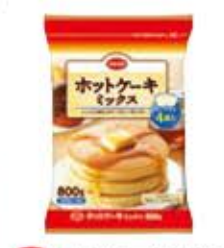
ホットケーキミックス 800g(200g×4袋) (次回2月1回)300円(税込)

【材料(1ホール分)】 甘納豆……………60g ホットケーキミックス……………200g 絹ごし豆腐……………1丁 牛乳……………50ml 卵……………1個 抹茶パウダー……………適量