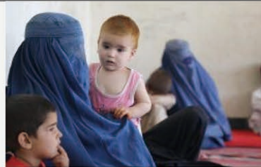
カブール南部にある高校に避難した親子。混乱の中、退避して家族と離ればなれになった子どもの家族の追跡と再会を支援しています。(アフガニスタン 2021年8月撮影)

ユニセフは世界中の子どもたちの命と健康を守るために活動する国連機関です。「子ども最優先」を掲げて支援活動を続けています。