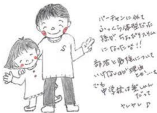
白山市 山のパーチャン