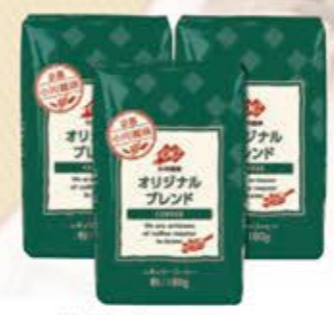
小川珈琲 オリジナルブレンド 180g(中細挽)×3袋 (次回10月3日) 1,186円(税込)

A 一般的にフィルターがコーヒーに浸かったままだと雑味が出てしまいがちですが、小川珈琲では雑味が出にくい原料を使っていますので心配りません。抽出後は早めに取り外してください。