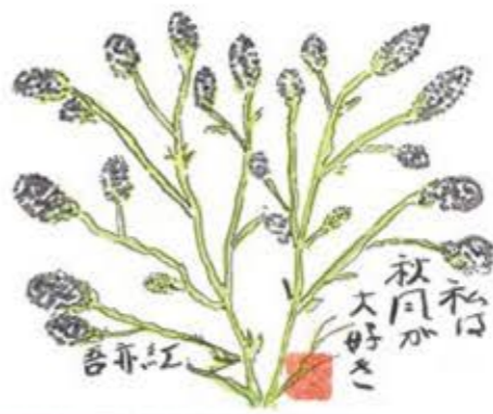
中能登町 山ばあば