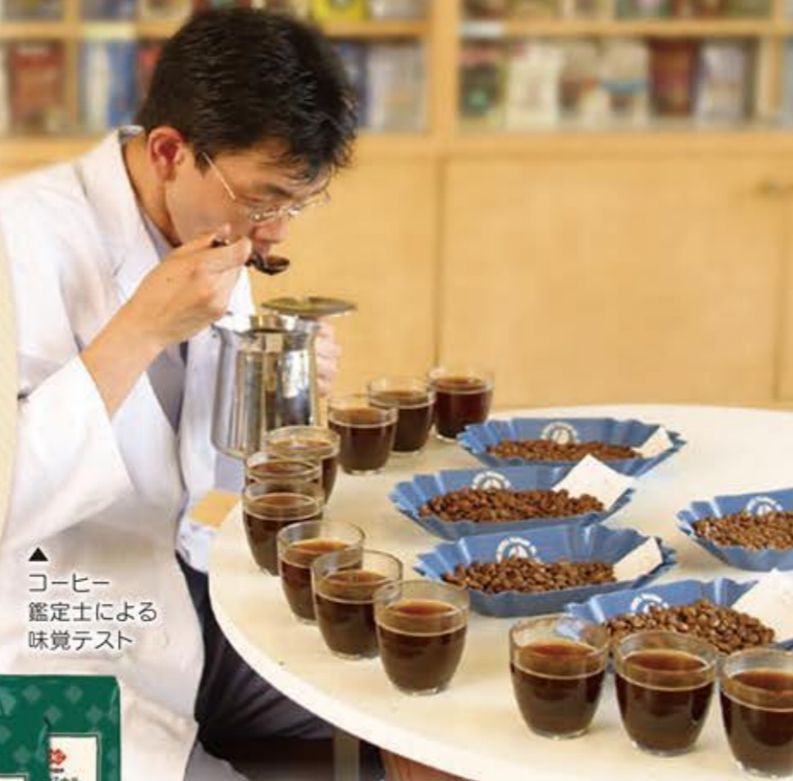
▲コーヒー鑑定士による味覚テスト