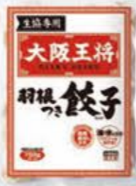
大阪王将 羽根つき餃子(生協専用) ぎょうざ735g、たれ8g×3袋 (次回8月4回) 538円(税込)