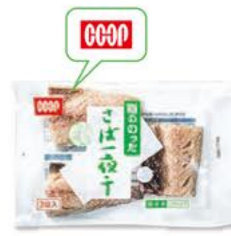
コープ北陸開発商品

Q ごぼうを切ったら赤っぽくなって、中心にスが入っていることがあります。なぜですか?