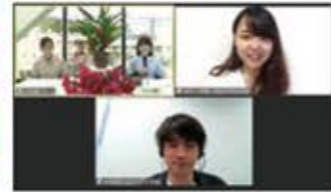
全国大学生協連の平和の取り組み報告