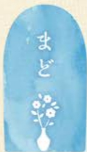
機関紙モニターによるエッセイ