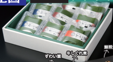
ずわい蟹 牛しぐれ煮 鱈照焼き