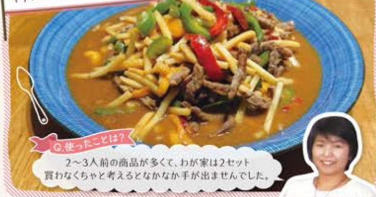
大阪王将 牛チンジャオロースセット

時短デリはカット済みの野菜や肉・魚、調味だれのセットで、レシピも付いています。冷蔵・冷凍のものがあり、開封して加熱するだけで短時間で完成します。