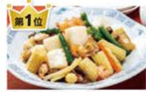
第1位 具たっぷりシーフード 八宝菜(白湯スープ味) 冷蔵 (次回6月3回) 430円(税込)