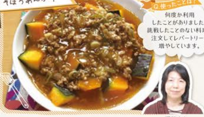
かぼちゃの中華風 きぼろあんかけ

日頃、レシピを考えることを面倒に感じているので、レシピを考える必要がないのも楽。料理のレパートリーに悩んでいる方は自分で作ったことのない料理を作るきっかけになっていいかも。毎日のお弁当にお困りの方、朝パッと作って詰めるだけのお弁当が完成できそうです。