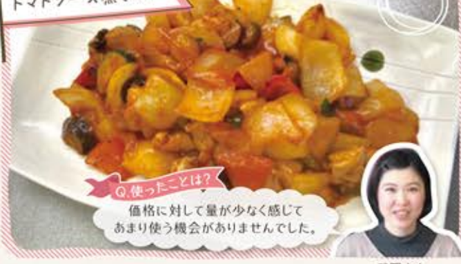
ラタトゥイユ風 トマトソース煮セット