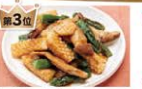
第3位 いかとアスパラ・ えりんぎの中華 冷蔵 (次回6月5回) 430円(税込)