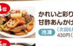
第4位 かれいと彩り野菜の 甘酢あんかけ 冷蔵 (次回6月4回) 430円(税込)