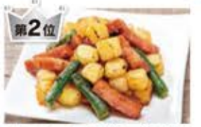
第2位 ベーコンとアスパラ・ポテの バター風味醤油炒め 冷蔵 (次回6月4回) 430円(税込)