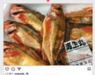
#コープたまぼこ #コープおおぬか #コープいしかわ店舗情報