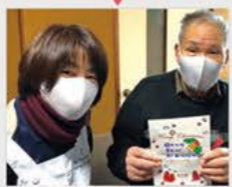
#コープいしかわ福祉事業