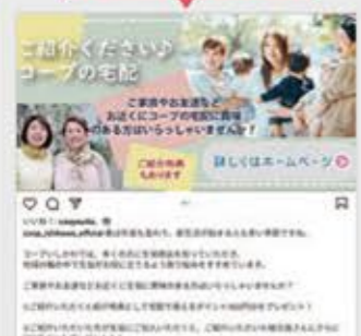
#コープいしかわ宅配情報