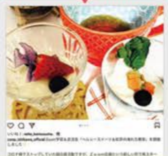
#コープいしかわ組合員活動