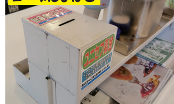
レジを通過した後のサッカー台に募金箱を置いてあります。