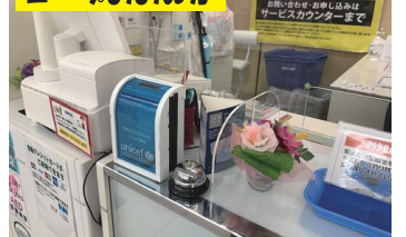
サービスカウンターに募金箱を置いてあります。