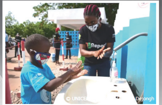
若者たちが子どもたちに正しい手洗いの方法を伝えています。（コートジボワール）

ベトナムでは、学校の再開にあたって、感染症の広がりを防ぐために教育訓練省が設けた「安全基準リスト」の内容を満たす必要がありました。リストには衛生的な環境、食品衛生、医療・衛生用品（体温計や石けんなど）の整備と、体温チェック、マスクの着用、教室での適切な距離をとることなどが含まれています。子どもたちが安全に学校に戻ってこれるようユニセフの支援によって、そうした安全対策を実施しました。