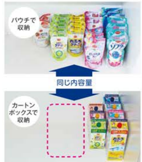
パウチに比べてこんなにスッキリ、省スペース