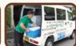
購入商品の配達や買物代行をします