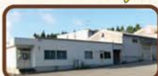
穴水町にあります