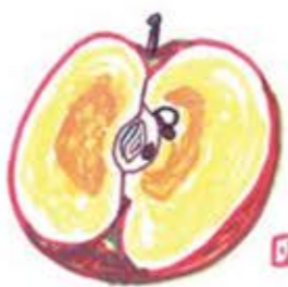
金沢市 りんごちゃん

せのハギレで孫用の立体マスクを作りました。捨てなくて良かった。野々市市ダッフィー ヨレヨレになったTシャツ 何十年も使っている色あせたTシャツ。着古してやわらかくなり、肌になじんで着心地が良くなかなか捨てられないです。外出時には着て出ていく勇気はないですが、パジャマ代わりに愛用しています。