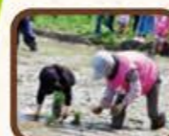
植付から収穫まで体験