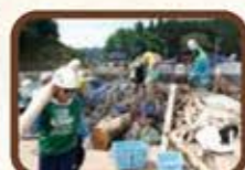
2018年までのべ28回運行