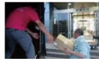
おにぎりを小松市の避難所へ届けました。(2017年8月)

県内全ての自治体(県・19市町)と災害時支援協定を結んでいます。県内で避難所が開設された際には自治体の要請に応じておにぎりなどの調達運搬を行います。