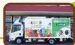
県内48か所に停留所