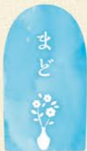
機関紙 モニターによる エッセイ

自然はいつもそこにあるだけで何物にも代えがたい素晴らしい感動を与えてくれます。新緑の5月。やわらかな若葉があなたに届きますように。