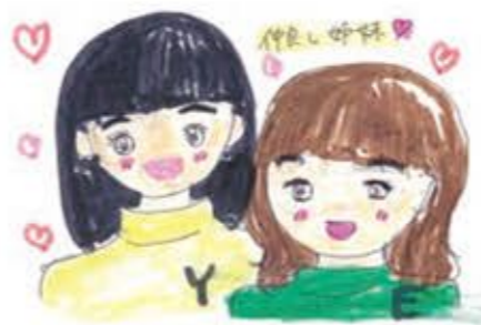
野々市市 ことつねこ