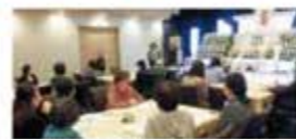
コープ葬の学習会(2019年)

価格体系がわかりにくいなど葬儀に関する疑問や不安をなくしたいという期待に応えて葬祭事業がはじまりました。オリジナルのエンディングノートも作成しました。