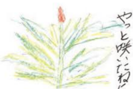
かほく市 きよちゃん