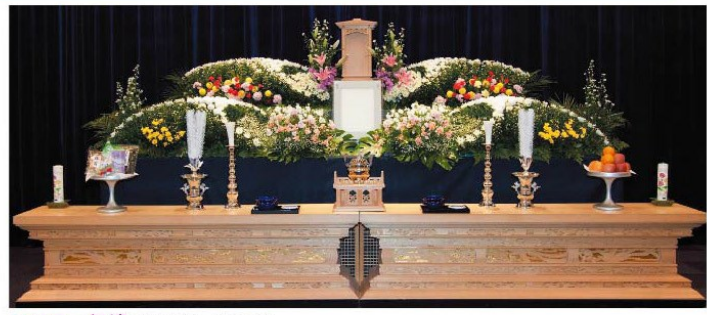
フラワー祭壇 (写真は一例です)

対象となるのは、故人または喪主が組合員の2親等以内であることです。 組合員ご本人の葬儀はもちろんのこと、組合員の祖父母が亡くなった場合や、喪主が組合員の兄弟姉妹の場合も大丈夫です。