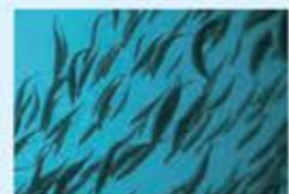
海中のさばの群れ