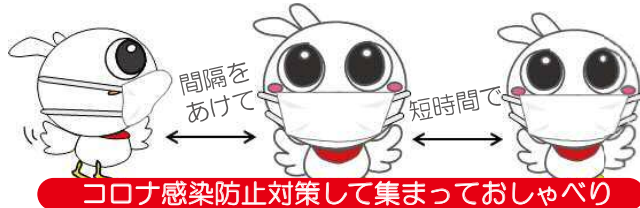
コロナ感染防止対策して集まっておしゃべり

おしゃべりコープの目的 ・おしゃべりする“きっかけ”や、人と人とのつながりを応援します。 ・寄せられた「声」から、毎年くらしの関心事を集計し活動にいかします。