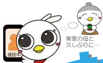
電話でおしゃべり