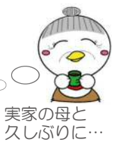
実家の母と久しぶりに…