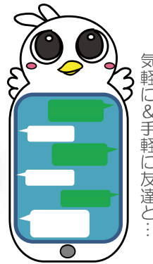
気軽に＆手軽に友達と…