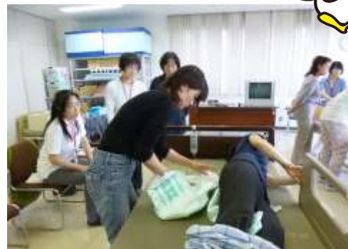
身体介護実技研修