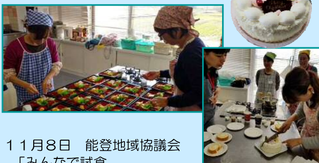
11月8日 能登地域協議会 「みんなで試食 ☆キラキラケーキ☆」