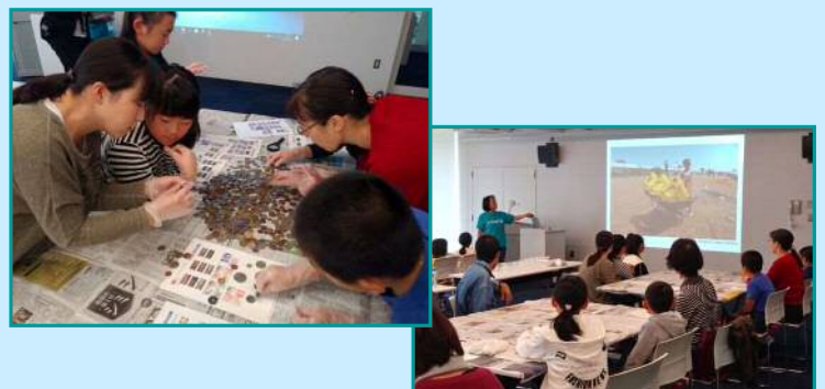
11月11日 組合員活動部・ユニセフ 「ユニセフ外国コイン仕分け」