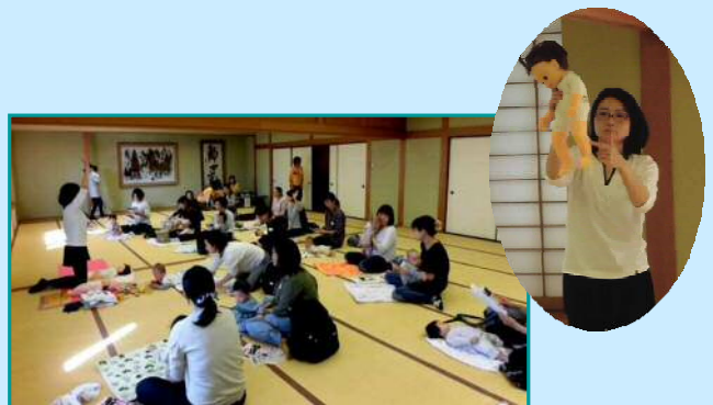
10月26日 石川西地域協議会 「ベビーマッサージで親子のスキンシップ」