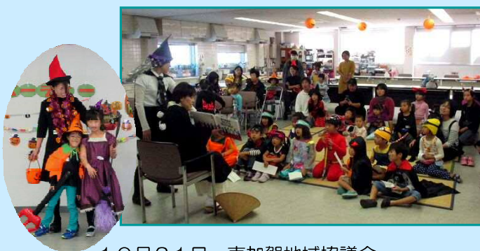
10月21日 南加賀地域協議会 「親子でハロウィンパーティー」