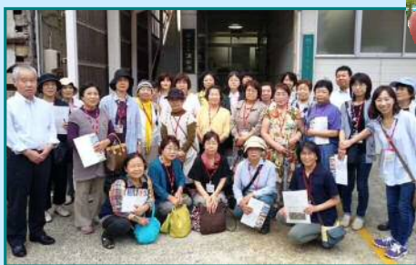
9月12日 能登地域協議会 「スギヨづくしで旅を満喫ツアー」