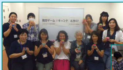
9月6日 石川東地域協議会 「防災ゲーム☆アロマキャンドル作り」