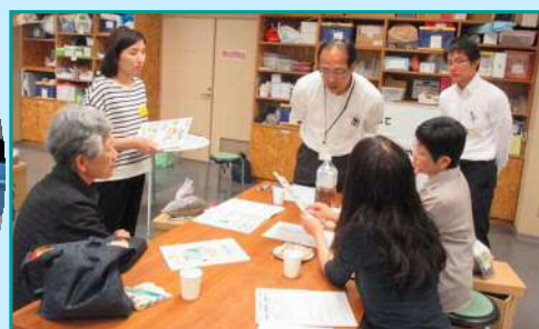
5月8日 石川東地域協議会 「ゴミを減らして知恵を増やそう！」