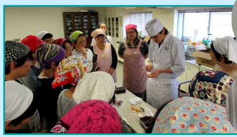
5月31日 南加賀地域協議会 「和菓子作り」