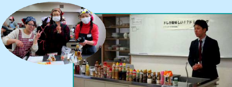
3月9日 石川東地域協議会 「ドレッシングが美味しい!? ドレッシング」