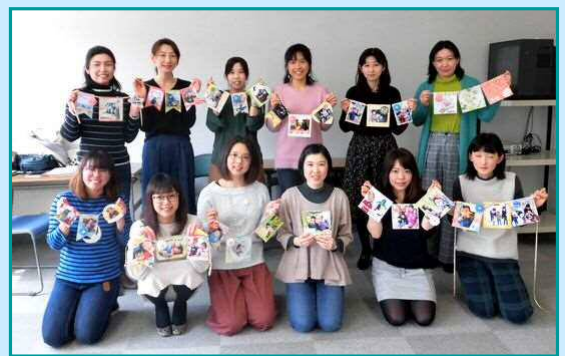
3月13日 石川西地域協議会 「スクラップブックに挑戦！」