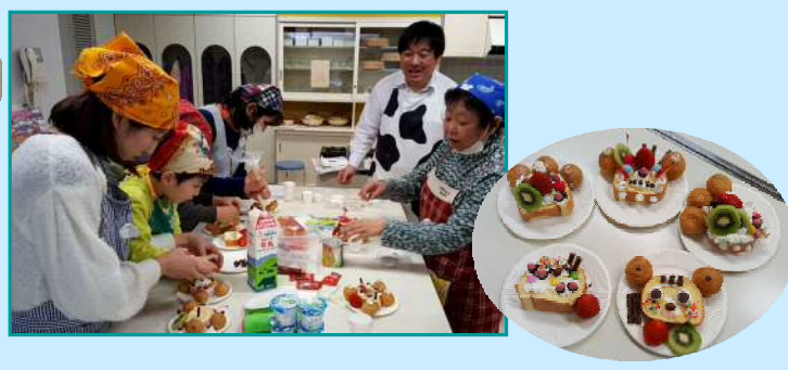
2月11日 能登地域協議会 「ロールケーキ デコってみんなけ?!」