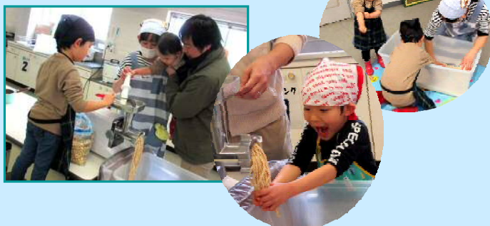
2月25日 南加賀地域協議会 「手作りが一番おいしい！みそ作り」