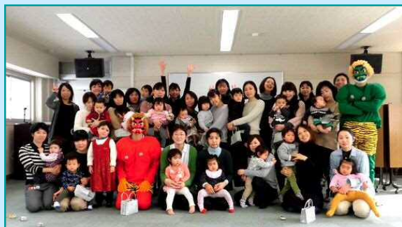
1月29日 石川西地域協議会 「親子で豆まき&リズムあそび」