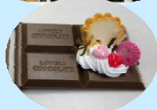
1月28日 南加賀地域協議会 「親子で作る！バレンタインのスイーツデコ」