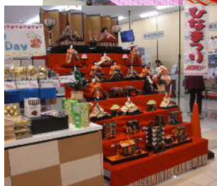
店内に本物のお雛様が出現！（上：たまぼこ、左：おおぬか）

2月の下旬から3月3日にかけて、コープたまぼこ・コープおおぬかの両店では桃の節句を祝う「もうすぐひなまつり」セールを実施しました。野菜・果物売り場では旬のいちごや色とりどりのカットフルーツが、魚売り場では手巻きすしの具材が、お菓子売り場では、桜餅や春の新品が並ぶなど店内のあちこちでひなまつりや春を感じる商品が満載となりました。店内では、華やかなちらしすしの調理見本を準備し、ひなまつりレシピの提案をするなどして、来店した組合員へのお役立ちをはかりました。今後も地域の皆様に喜んでいただける取り組みをすすめてまいります。みなさまのご来店をお待ちしております。