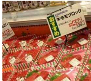
お肉売り場ではもも肉をおすすめ