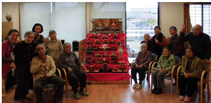
雛壇を囲んで記念撮影。少し緊張される方や満面の笑みをされる方も。

3月3日（土）、デイサービス「こーぷあいいい」では、3月恒例の「ひなまつり会」が行われました。今年は、午前中に「おひなさま風呂」として、あいいいの庭で園芸の時間に栽培されたローズマリーを乾燥させたものをお風呂に入れて、利用者みなさんにさわやかな香りで春を感じていただきました。午後にはボールを棒で押して穴に入れる「コロコロおひなさまゲーム」を楽しみ、日頃の体操の成果もあって、高得点を出す方も。みんなで「ひな祭り」の歌を大きな声で歌ったりして、利用者の方の笑顔もたくさん見ることができました。これからも利用者みなさんに、あいいいに来る日が楽しみだと思っていただけるように楽しい行事を提案していきます。