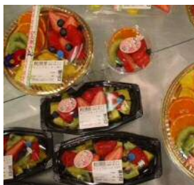
カラフルなフルーツ