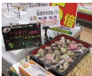
特大の国産はまぐり