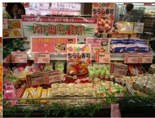
充実のちらし寿司の具材コーナー