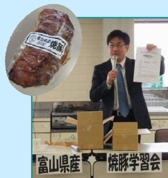
11月15日 南加賀地域協議会 「富山県産焼豚学習会」