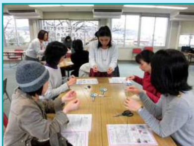
11月30日 石川西地域協議会 「水引アクセサリを作っちゃおう」