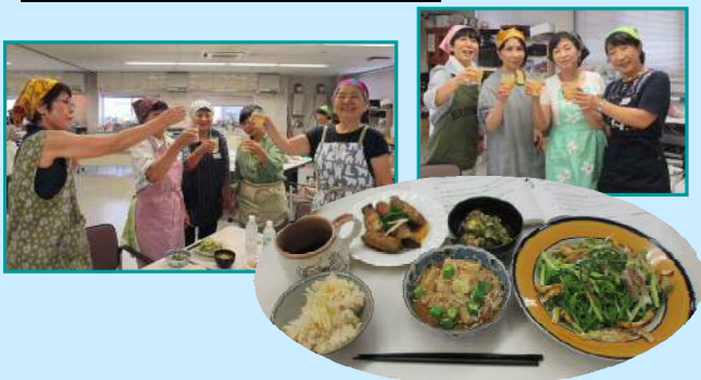
8月28日 南加賀地域協議会 「夏こそ！ おいしいしょうが料理！」