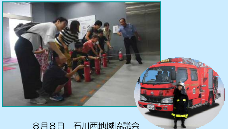
8月8日 石川西地域協議会 「夏休み親子で防災バスツアー♪」