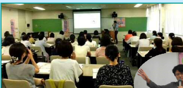
7月10日 組合員活動部 LPAの会 「楽しくたまる貯蓄&投資」