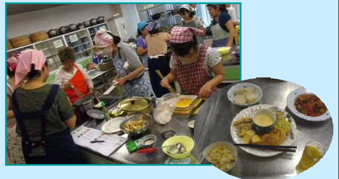
7月13日 石川東地域協議会 「おいしさの秘密は千代の一番」