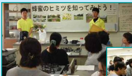
6月19日 石川西地域協議会 「蜂蜜のヒミツを知ってみよう！」