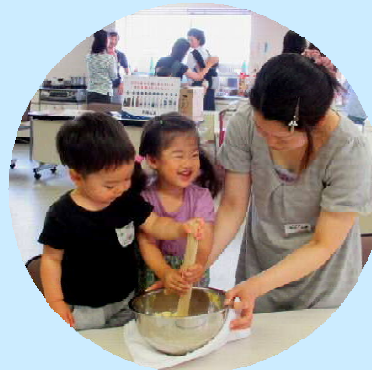
6月26日 南加賀地域協議会 「カルピス学習会」