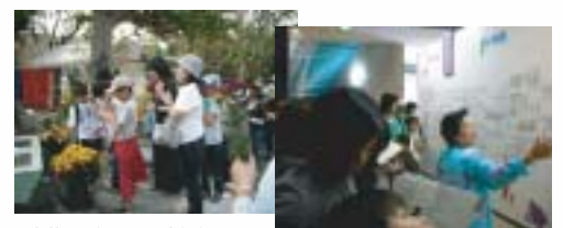
献花する全国からの参加者たち

ぼくは、対馬丸記念館が一番心に残りました。対馬丸がアメリカの潜水艦の魚雷で沈没し、亡くなった人は、ぼくと同じくらいの人だというのがすごく悲しかったです。やはり戦争は絶対にしてはいけないと思いました。